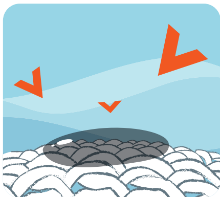
Enzymy pôsobia na škvŕny

Vysoko účinné zložky, ktoré zabezpečia výnimočné odstraňovanie škvŕn a čistenie tých najodolnejších škvŕn po profesionálnom použití.